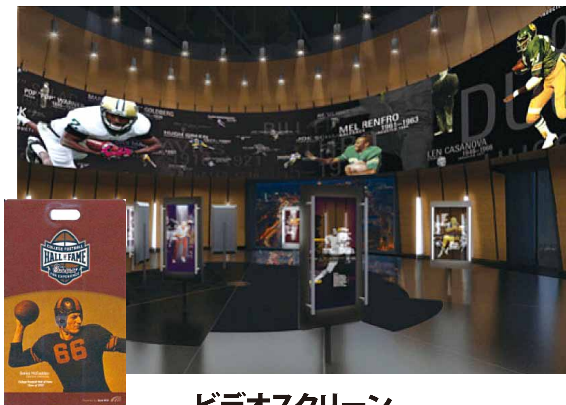
ビデオスクリーン

入館証にエイリアンテクノロジーGタグ(ALN-9654)を内蔵。 館内各所にエイリアンテクノロジー9900+リーダー100台を設置。