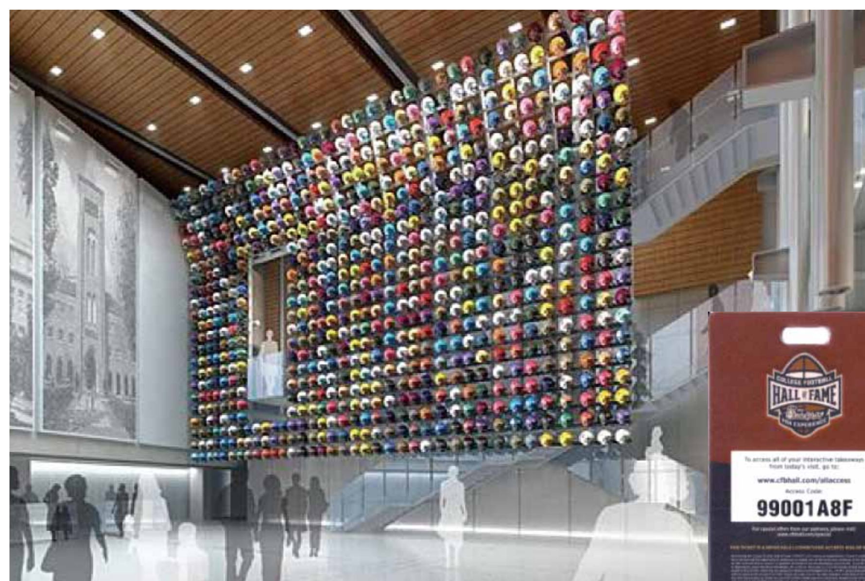
ヘルメット・コレクション